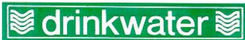
Figuur 2: Sticker “drinkwater”