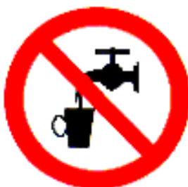
Figuur 4: Pictogram “geen drinkwater”

of een bordje of sticker met de afbeelding (volgens NEN 3011), zoals hieronder is aangegeven: