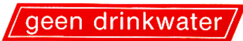
Figuur 3: Bordje/sticker “geen drinkwater”

of een bordje of sticker met de afbeelding (volgens NEN 3011), zoals hieronder is aangegeven: